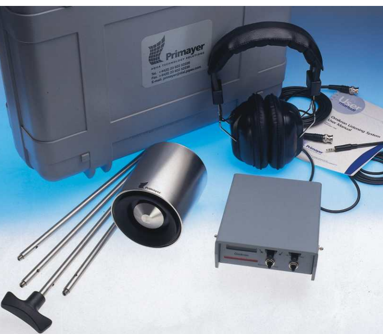
Equipo combinado Omikron \alpha+7 junto a su robusta maleta de transporte.

El sensor de varilla y el micrófono de suelo incorporan una alta tecnología que les permite detectar ruidos de fugas fuera del rango de audición del ser humano. El micrófono de suelo está montado sobre una estructura de acero inoxidable aislándole frente a los posibles ruidos inducidos por el viento.