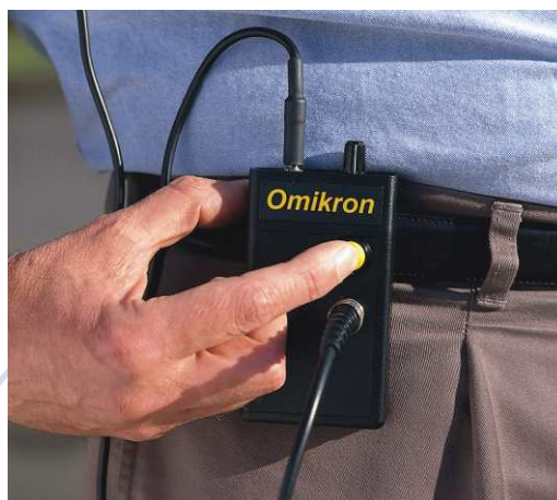
Amplificador "de bolsillo" del Omikron