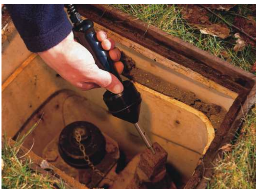
Ejemplo de escucha mediante varilla en una boca de riego.