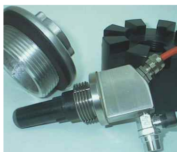
Los hidrófonos se adaptan a diversos tipos de conexiones en hidrantes y bocas de riego