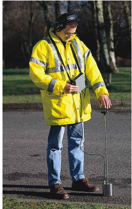
Omikron \gamma : amplificador avanzado junto a micrófono de suelo (geófono)