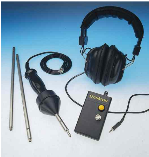
Omikron \alpha : sensor de varilla y amplificador

El Omikron \alpha escucha el ruido generado por la fuga colocando su sensor de varilla en contacto con algún elemento físico de la red. Por otra parte, este sonido se propaga hacia la superficie a través del suelo existente entre la conducción y la superficie. Por ello, también es posible localizar la fuga mediante el empleo del Omikron \beta , dotado de un micrófono de superficie (geófono) y su correspondiente amplificador.